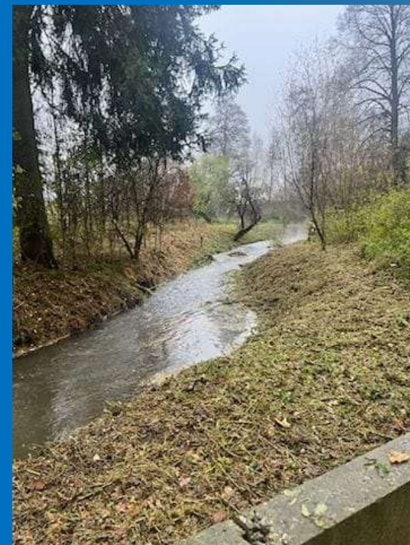
Po wykonaniu prac porządkowych