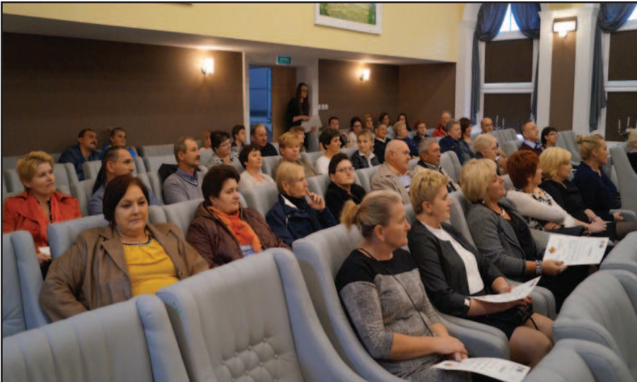
9 października 2016 r. uroczystie podziękowano mieszkańcom, którzy zaangażowali się w organizację pielgrzymki.