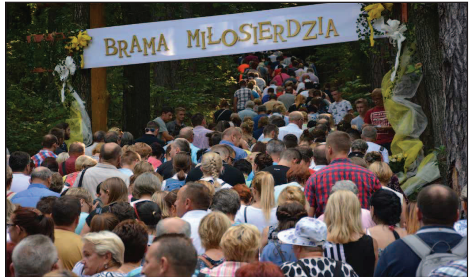
W 2016 r. uzbierano kwotę 17 616,28 zł, którą przekazano w całości na rzecz Fundacji Na Ratunek Dzieciom z Chorobą Nowotworową.