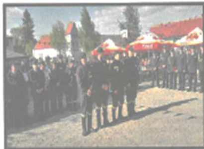
Jubileusz OSP Przybyłowice

strzały armatnie, występy artystyczne dzieci, Iskierki z Pomocnego i zespołów ludowych, a także wiele innych atrakcji przygotowanych przez druhowa jednostek przyciągnęły do Przybyłowic (7.05.2016r.), Męcinki (29.05.2016 r.) i Pomocnego (23.07.2016r.) wielu mieszkańców z okolicznych sołectw.