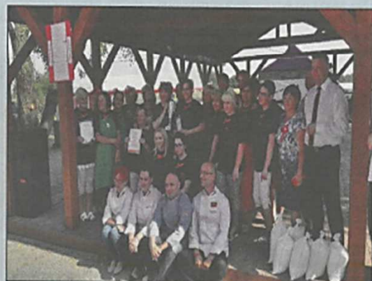
Święto Makaronu w Przybyłowicach