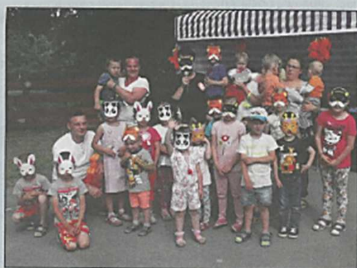
Piknik Rodzinny w Chroślicach