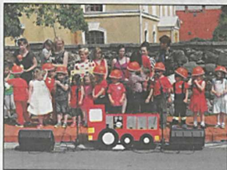
29 maja 2016r. Ochotnicza Straż Pożarna w Męcince obchodziła swoje 70-lecie. Z tej okazji dzie-

ci z przedszkola w Męcince i Piotrowicach wystąpili z częścią artystyczną. Dzięki dużemu zaangażowaniu nauczycielek i rodziców przedszkolaki były bardzo dobrze przygotowane i doskonale zaprezentowały się zgromadzonej publiczności. Krasnale Radusie z Męcinki zaprezentowały dwa tańce: „Maryneczka” oraz „Nie chcę Cię” znaną przedszkolaki z Piotrowicze zaśpiewały piosenkę „Jedźcie Straż Pożarna”. Najmłodsze dzieci wystąpiły z wierszami. Na koniec występu przedszkolaki z Męcinki wręczyły na ręce komendanta OSP laurkę z życzeniami. Dzieci z przedszkola w Piotrowicach zaśpiewały sto lat wszystkim strażakom oraz wręczyły komendantowi OSP własnoręcznie wykonany obrazek.