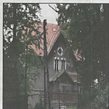
Budynek w Pomocnem