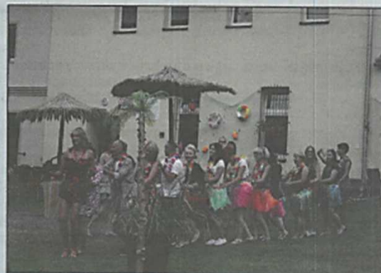
Impreza Hawajska w Kondratowie