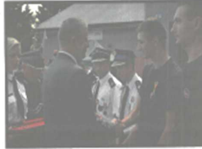
Jubileusz OSP Pomocne

Spółeczność lokalna samodzielnie przygotowała teren imprezy, zorganizowała konkurs koszenia łąk oraz wiele różnorodnych atrakcji.