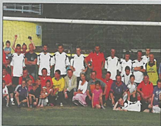
Dzień Chłopa w Chelmcu