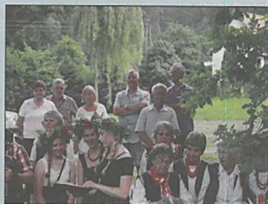
Noc Świętojańska w Męcince