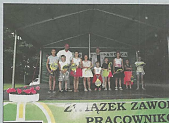
Święto Tulipanowca w Sichowie