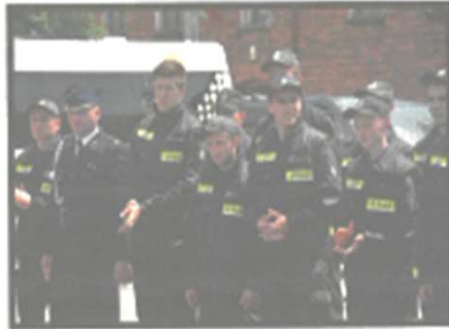
Jubileusz OSP Męcinka