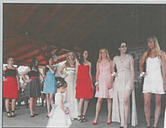
Festyn Św. Krzysztofa w Myślinowie