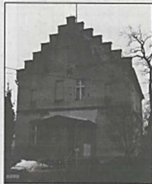
Budynek w Męcince

Działka w miejscowym planie zagospodarowania przestrzennego gminy mieści się w konturze oznaczonym jednostką K-MU – teren zabudowy mieszkaniowo – usługowej oraz K-ZI – teren zieleni izolacyjnej.