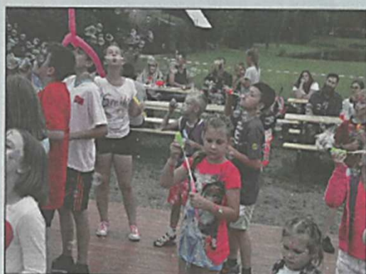
Festyn rodzinny w Małuszowie