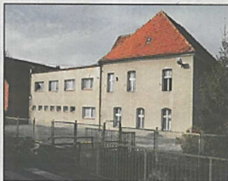
Budynek w Piotrowicach