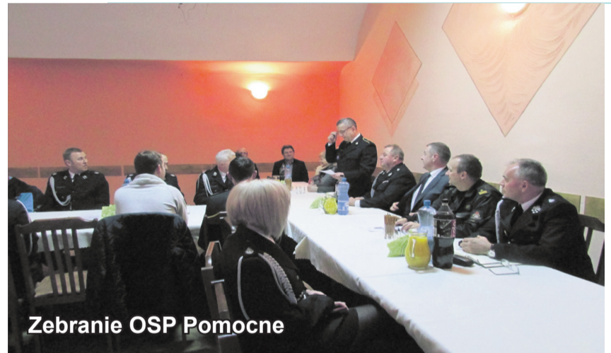
Zebranie OSP Pomocne

„Na dzisiejsze zebranie przyszedłem do Was z ważną informacją. Jako Gmina pozyskałyśmy ze środków unijnych ponad pół miliona złotych i już w tym roku dostaniecie nowy samochód ratowniczo – gaśniczy” – poinformował wójt, który ponadto wręczył druhom sześć dodatkowych bluz strażackich.