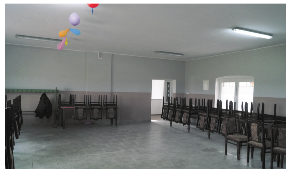
Odrementowana świetlica w Sichówku. To najmniejsze w Gminie Męcinka sołectwo ma od wielu lat oczekiwane miejsce spotkań i aktywności społecznej.