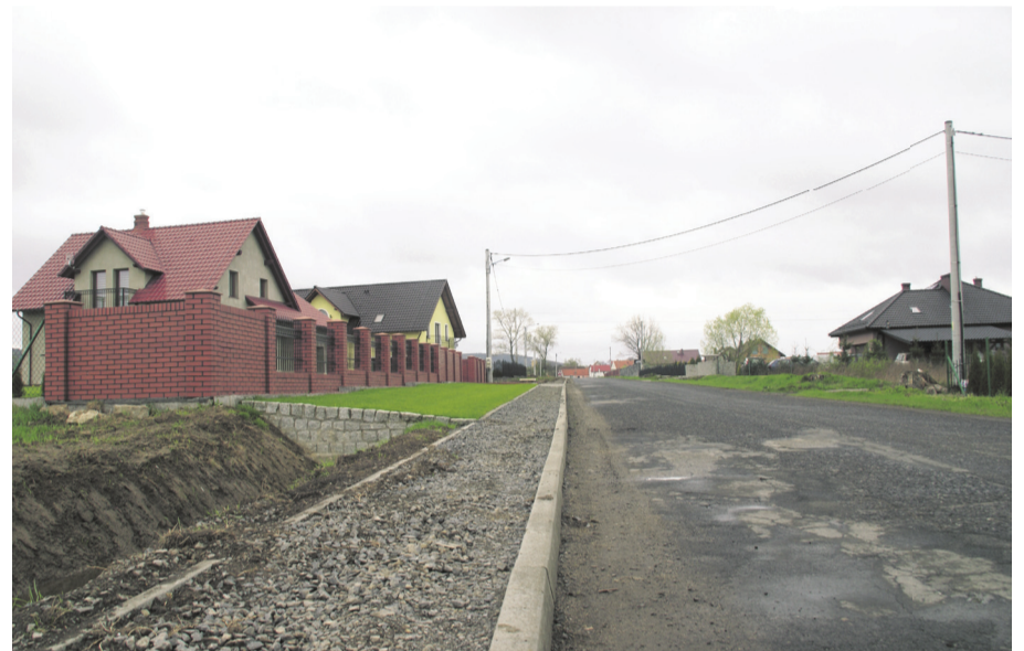
Dobiega końca budowa prawie dwukilometrowego chodnika w Nowej Męcince. Inwestycja ma na celu poprawę bezpieczeństwa mieszkańców.