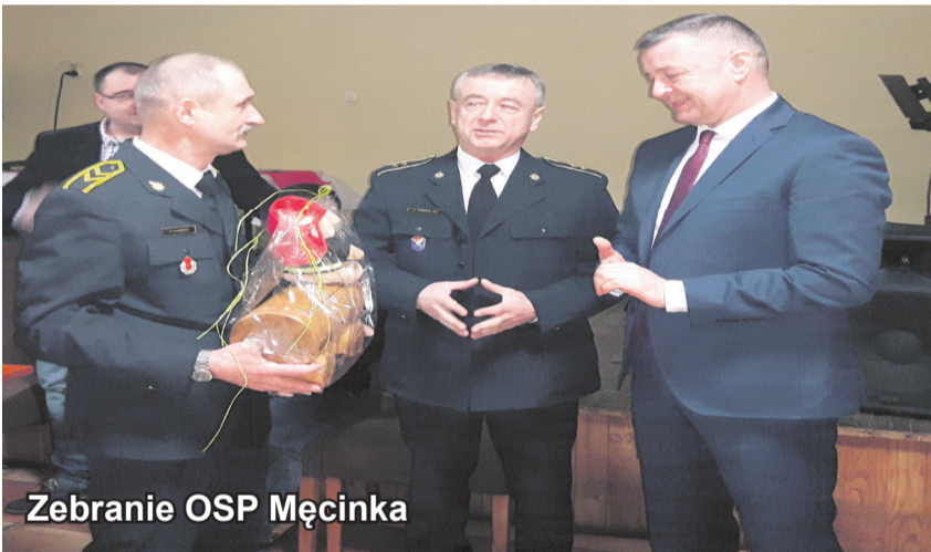
Zebranie OSP Męcinka

Szczególne podziękowania druhom za pracę na rzecz bezpieczeństwa mieszkańców złożył Wójt Gminy Męcinka podkreślając również duże zaangażowanie jednostek przy organizacji wydarzeń gminnych poprzez pozyskiwane dotacje, pomoc organizacyjną i zabezpieczanie przeciwpożarowe, a także udzielanie pomocy mieszkańcom obszarów górskich gminy poprzez dowożenie wody czy pomoc przy awarii sieci kanalizacyjnych. Wójt podziękował również strażakom za aktywność przy organizacji uroczystości religijnych oraz nieustanną gotowość do niesienia pomocy drugiemu człowiekowi.