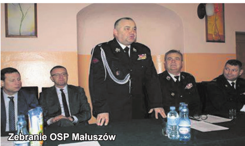
Zebranie OSP Małuszów

Podczas zebrania strażacy usłyszeli podziękowania za całoroczną pracę i gotowość bojową, w szczególności z uwagi na fakt, że jednostka pracuje w trudnych i specyficznych warunkach górskich. Wójt poinformował druhow, że podjął starania w celu zakupu samochodu bojowego dla jednostki.