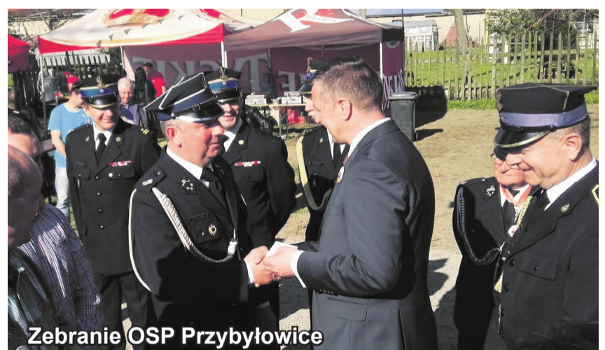
Zebranie OSP Przybyłowice

zabiegała o włączenie do systemu. „Podjęte przez nas działania, aby wreszcie tak się stało miały na celu przede wszystkim poprawę bezpieczeństwa mieszkańców naszej gminy” – mówił wójt.