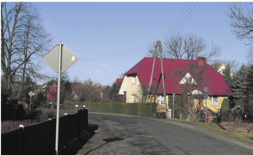
Dzięki pozyskanej dotacji już w tym roku zbudowany zostanie chodnik wraz z kanalizacją deszczową, przebudowana zostanie także droga. Mieszkańcy Sichowa bezpieczniej będą się poruszać w obrębie swojego sołectwa.