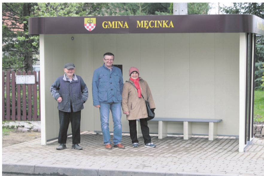
W celu poprawy estetyki i bezpieczeństwa mieszkańców wymieniono przystanki w Nowej Męcince, Męcince, Przybyłowicach i Piotrowicach.