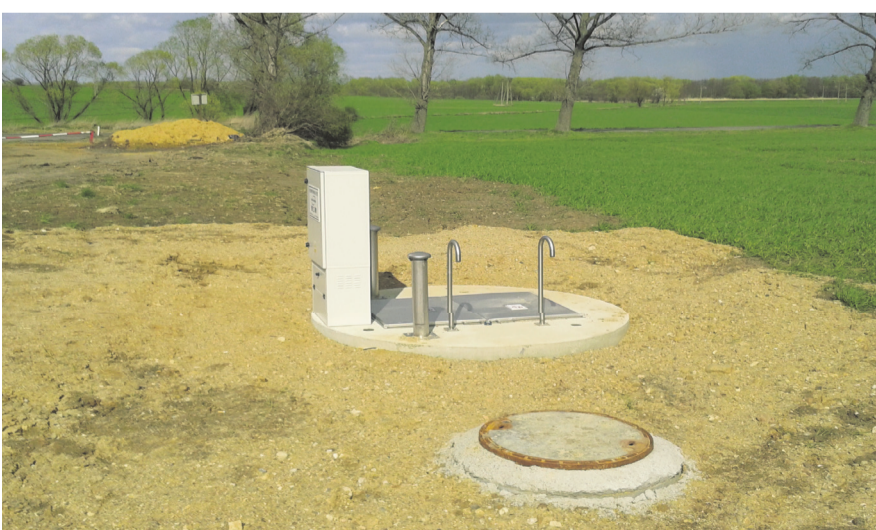
Budowa sieci kanalizacyjnej do Gminnej Strefy Aktywności Gospodarczej w Nowej Męcince wraz z modernizacją sieci wodociągowej tworzy warunki do rozwoju przedsiębiorczości w naszej gminie.